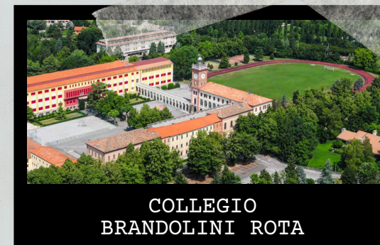
COLLEGIO BRANDOLINI ROTA

26 novembre ore 15.00 - 18.00 16 dicembre ore 18.00 - 19.30 14 gennaio ore 15.00 - 18.00 1° turno: ore 15.00-16.30 2° turno: ore 16.30-18.00