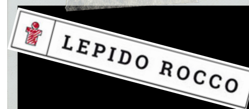
ISTITUTO LEPIDO ROCCO