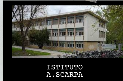
ISTITUTO A. SCARPA

19 novembre ore 15.00 - 18.00 03 dicembre ore 15.00 - 18.00 17 dicembre ore 15.00 - 18.00 21 gennaio ore 15.00 - 18.00 1° turno: ore 15.00-16.30 2° turno: ore 16.30-18.00