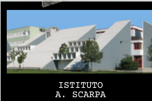
ISTITUTO A. SCARPA