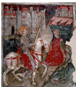
“San Giorgio e il Drago” affresco presente nella chiesa di San Giorgio, San Polo di Piave, Treviso

Elaborato dal Collegio Docenti 17 Dicembre 2021 Approvato dal Consiglio di Istituto 20 Dicembre 2021